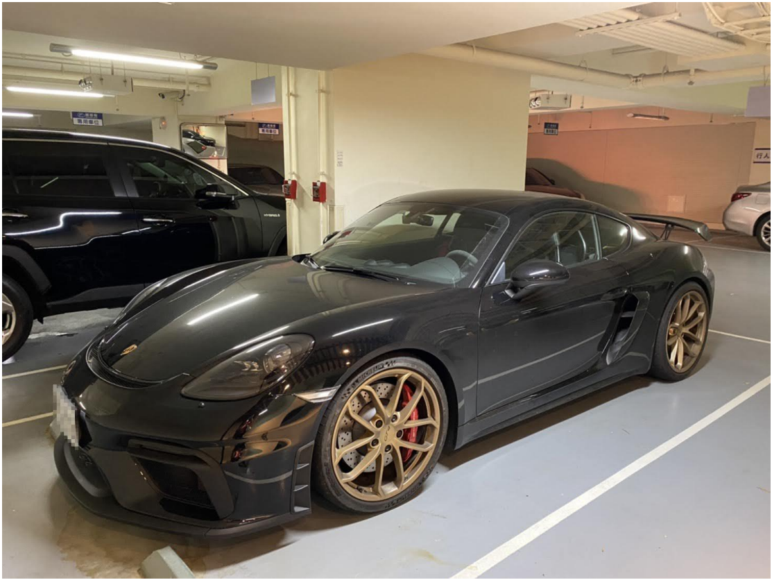
義務人名下的 Porsche 名車