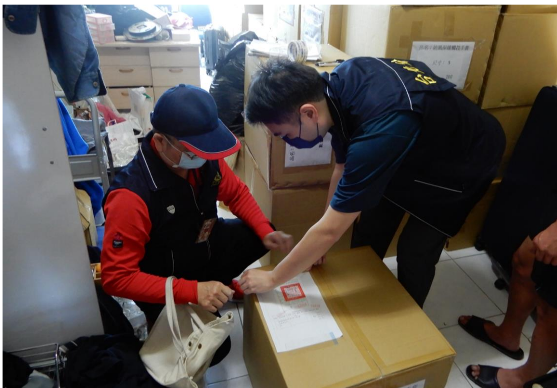
執行人員查封手套口罩組