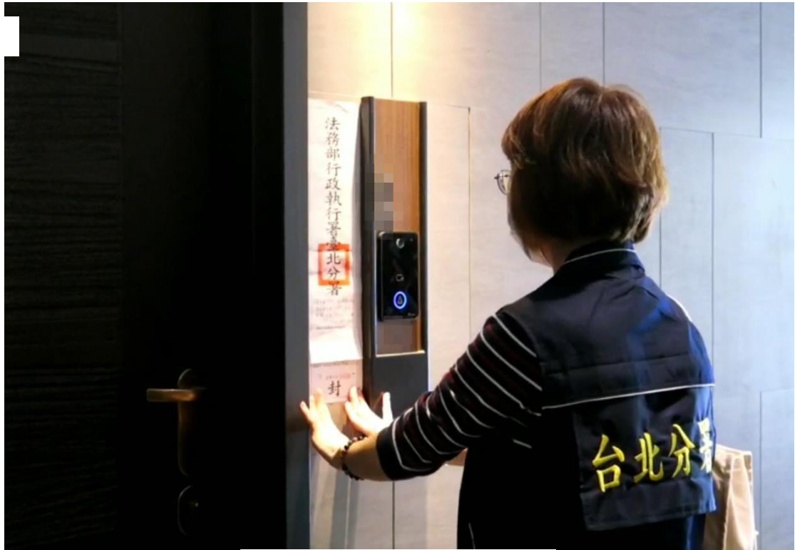
執行人員張貼封條