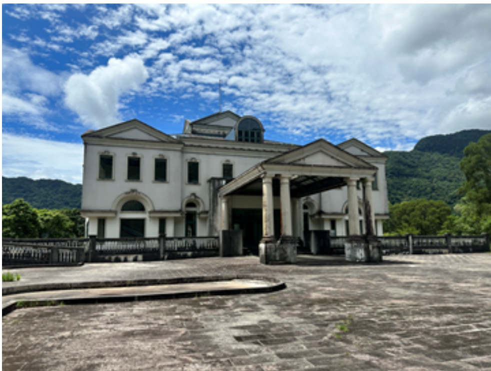
115 年 2 月 3 日拍賣滯欠大戶李○松的房產外觀