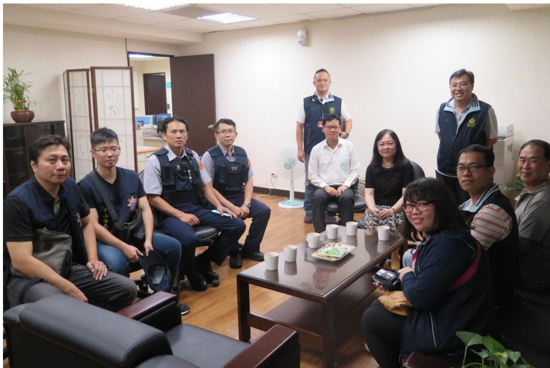
執行人員與警方、移送機關人員執行前會商對策。