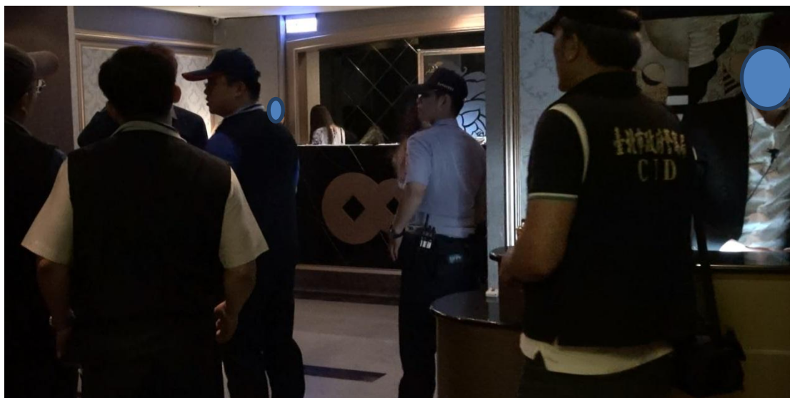
執行人員會同中山分局員警至巴黎情人酒吧現場執行