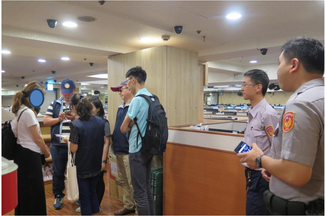
執行人員及移送機關會同大安分局員警至網路會館現場執行