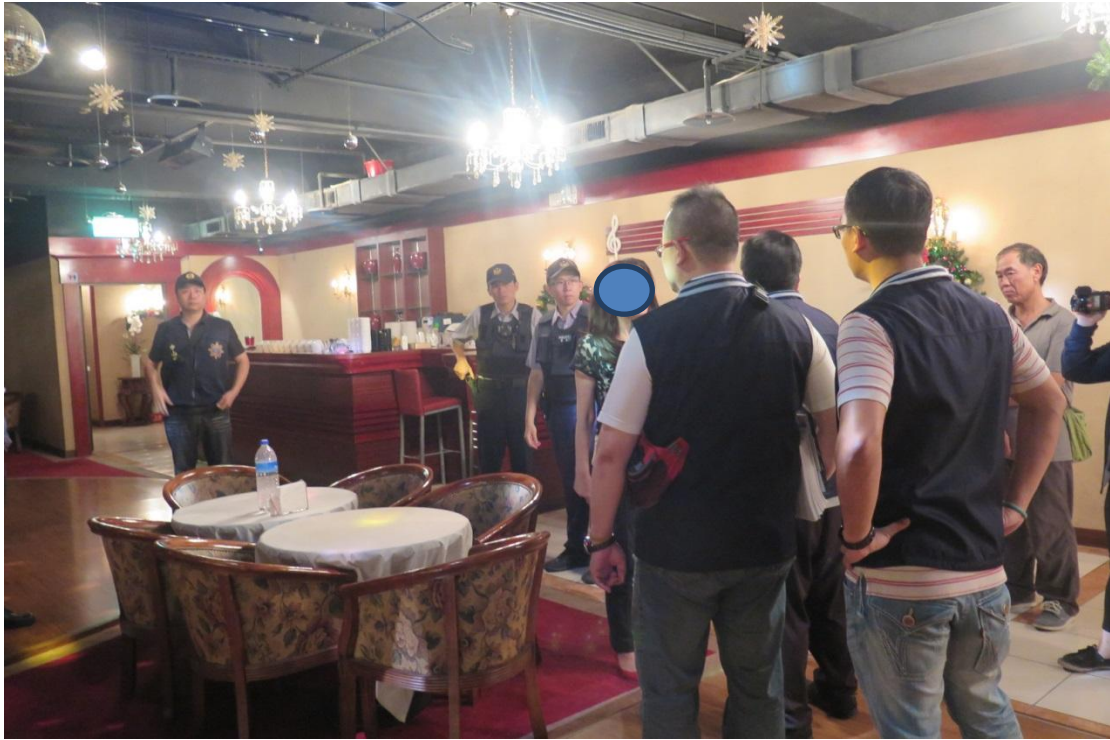
執行人員、移送機關會同中山分局員警至五線譜舞廳現場執行。