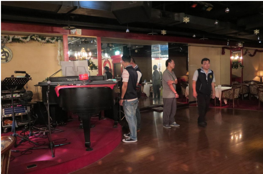
執行人員現場查封鋼琴、音響等動產。